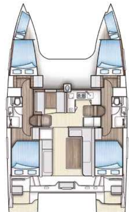
4-Kabinen-Version 4-cabin-version Version 4 cabines