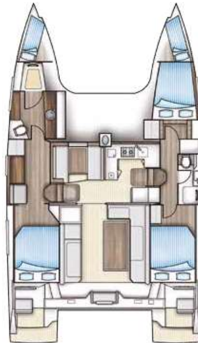
3-Kabinen-Version 3-cabin-version Version 3 cabines